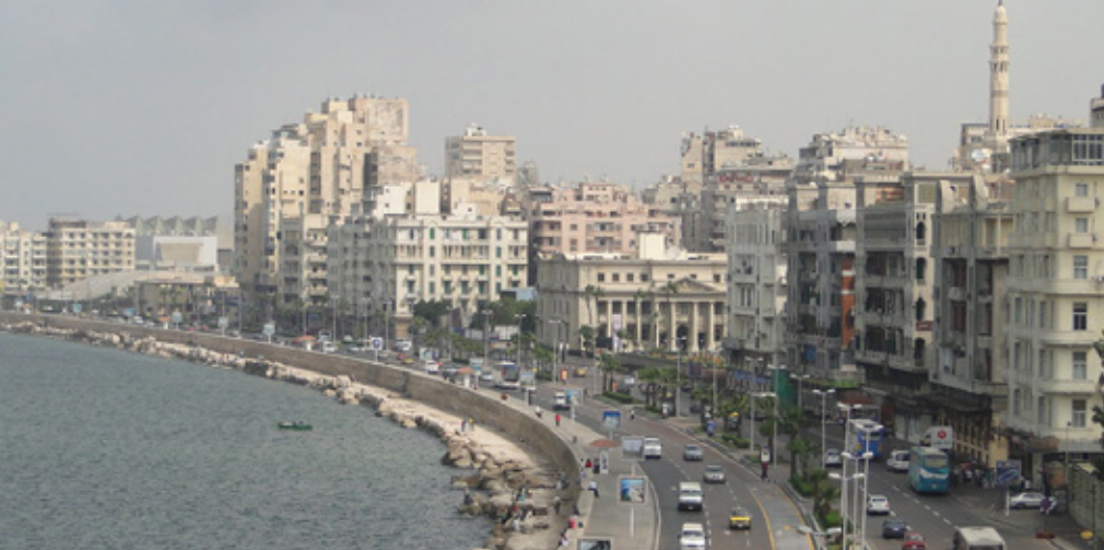
Egitto / Alessandria Facoltà di ingegneria dell'Università di Alessandria d'Egitto, nel centro città.