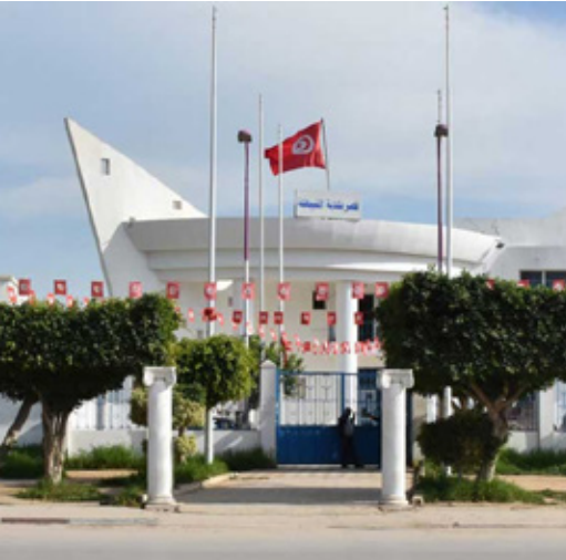
Tunisia / Mnihla palazzo municipale